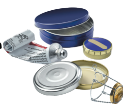
Boîtes, tubes, couvreclis