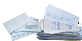
Enveloppes, papiers de bureaux, courriers