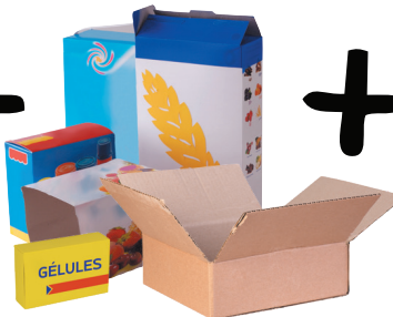
Boîtes et cartons