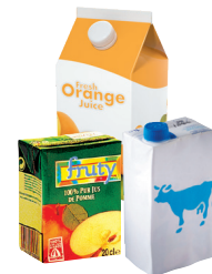
Briques avec ou sans bouchons