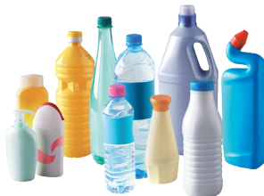
Bouteilles, flacons (avec bouchons)