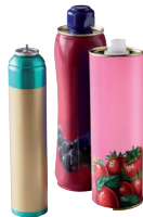
Bidons et aérosols