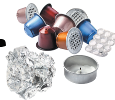
Capsules à café, petits contenants