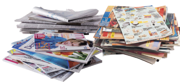
Journaux, prospectus, magazines