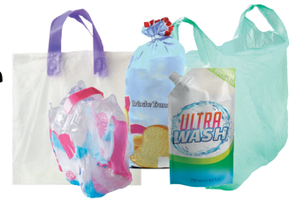
Sacs, sachets, tubes, sur-emballages, films plastiques