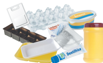
Boîtes, pots, blisters, emballages sous vide, barquettes