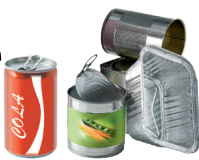
Conserves, barquettes, canettes