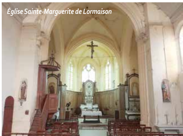
Église Sainte-Marguerite de Lormaison