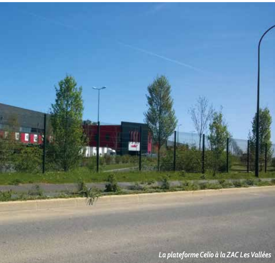
La plateforme Celio à la ZAC Les Vallées

lieux" de l'ensemble des structures et équipements. Réfléchir aux atouts du territoire permettra ainsi de dégager les principaux enjeux en matière d'évolution démographique, de logement, de déplacement sur le territoire, de développement économique, d'aménagement de l'espace, d'équipement, de services et de protection environnementale.