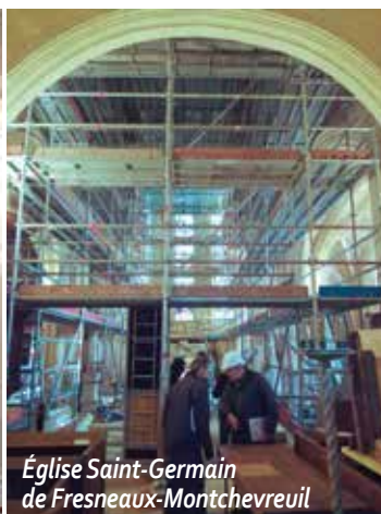
Église Saint-Germain de Fresneaux-Montchevreuil