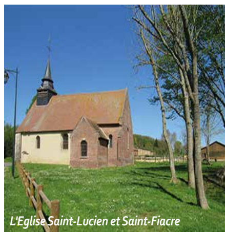
L'Eglise Saint-Lucien et Saint-Fiacre

Niché au creux d'un vallon, le village de Pouilly compte environ 160 habitants. Avec son église romane du XI ème siècle, son ancien lavoir et le centre équestre, la visite en vaut le détour. Pour les amateurs de randonnée, Pouilly se trouve être sur un circuit balisé allant de Saint-Crépin-Ibouvillers à Fresneaux-Montchevreuil.