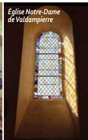
Église Notre-Dame de Valdampierre

Depuis la prise de compétence "Patrimoine" en juin 1999, près de 25 millions d'euros ont été investis par l'intercommunalité pour sauvegarder et restaurer le patrimoine architectural et historique de notre secteur. C'est une opération unique en France à l'échelon de l'intercommunalité. Actuellement, les travaux en cours concernent les intérieurs de trois églises. Réalisées avec l'appui d'entreprises spécialisées, les rénovations mettent parfois en lumière des détails jusqu'alors invisibles.