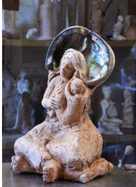
Maternité à la Conque, terre et haliotide, 2018

51 rue Roger Salengro 60 110 Méru contact@musee-nacre.com 03 44 22 61 74 www.musee-nacre.com