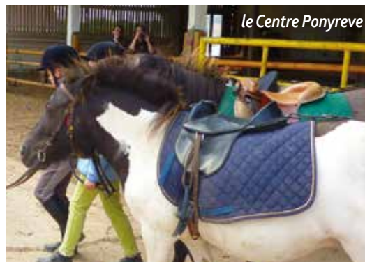
Le Centre Ponyreve