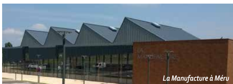
La Manufacture à Méru

sion du SCoT seront menées sur le territoire dans le cadre d'une concertation associant notamment les habitants et les associations locales. L'objectif ? Assurer une information complète des personnes concernées tout en leur permettant de faire part de leurs observations. Les informations concernant l'avancement de la révision du SCoT seront mises en ligne sur le site internet de la C.C.S et un registre sera mis à la disposition du public au siège.